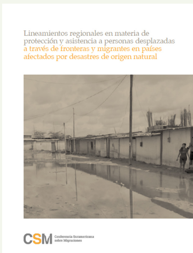
Lineamientos regionales aprobados por los países de América del Sur.